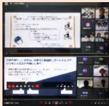
当日のミーティングの様子